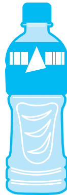
スポーツドリンク