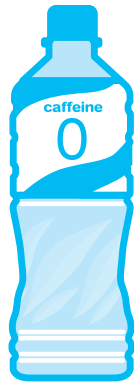
ノンカフェインのお茶など